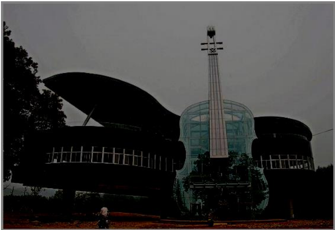
Een kantoor in de vorm van een piano. China.