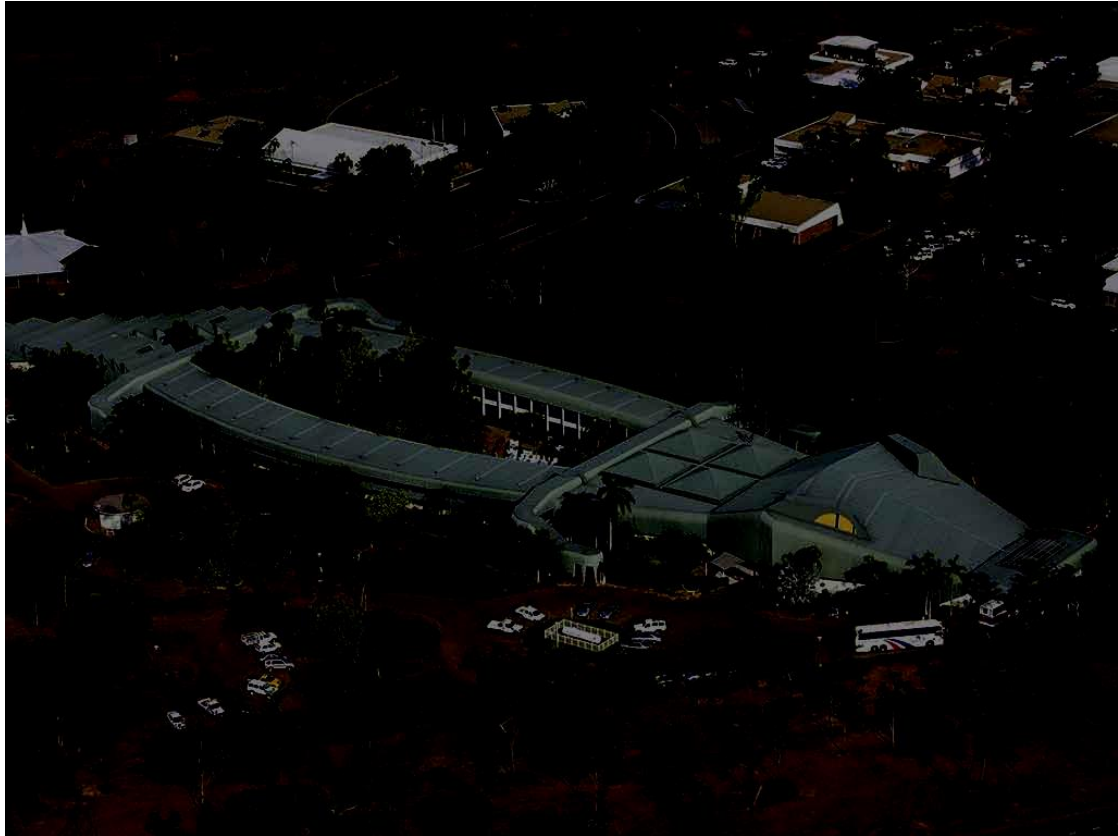
Een krokodillenhotel in Australië.