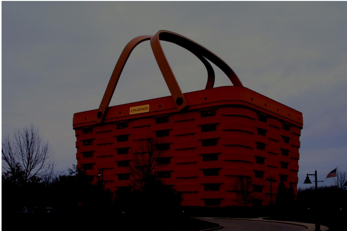
Het heet: 'Winkelmandje', omdat het een winkelmandje is. :) Hoofdkantoor in Amerika.