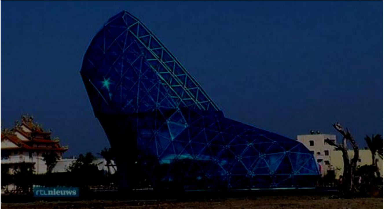
Hoge hakkenkerk in Taiwan. 16 meter hoog