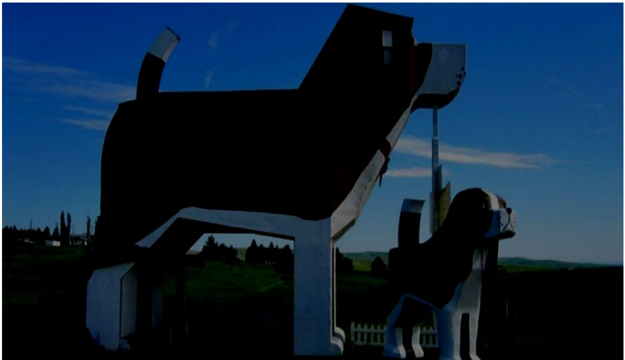
Het 'Hondenhuis'. Een hotel. Er zijn bedden in het hoofd en het lichaam. Amerika. Grote hond: 10 meter hoog.