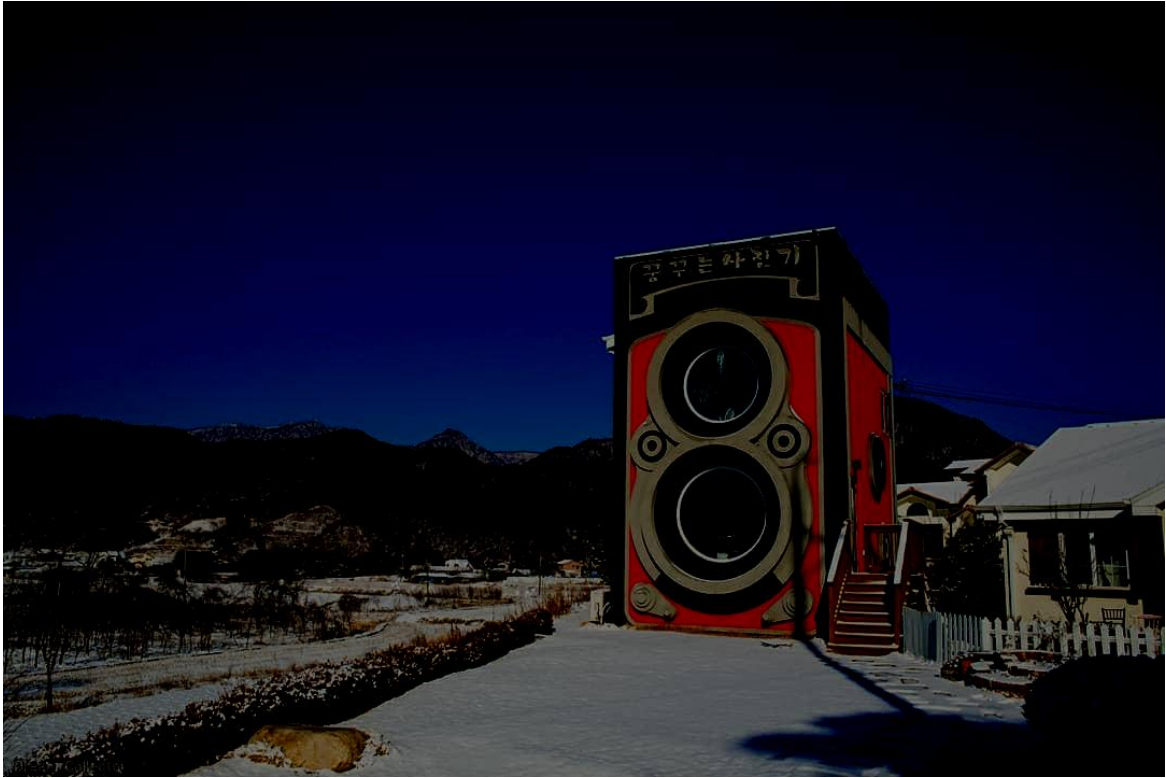
Camera-café in Zuid-Korea.