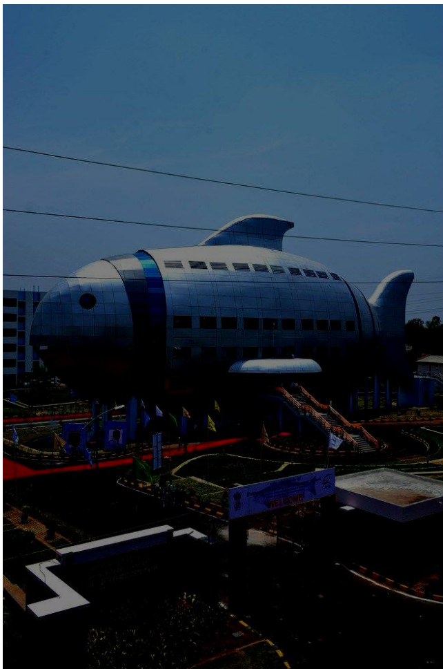
Het nationaal bureau voor de visserij.