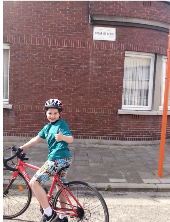
De dertiende stop.