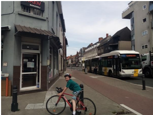
Dit is mijn derde stop waar zou ik heen gaan?