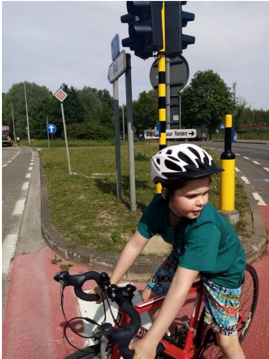
De twaalfde stop: Toppie!