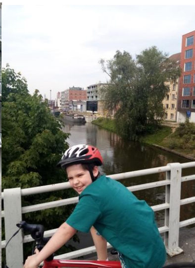
Dit is de vierde en vijfde stop. WAAR BEN IK?!