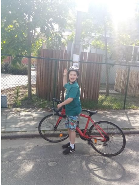
En het einde en als je het leuk vond laat het me weten en