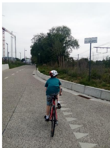
Dit is de zesde en zevende stop.