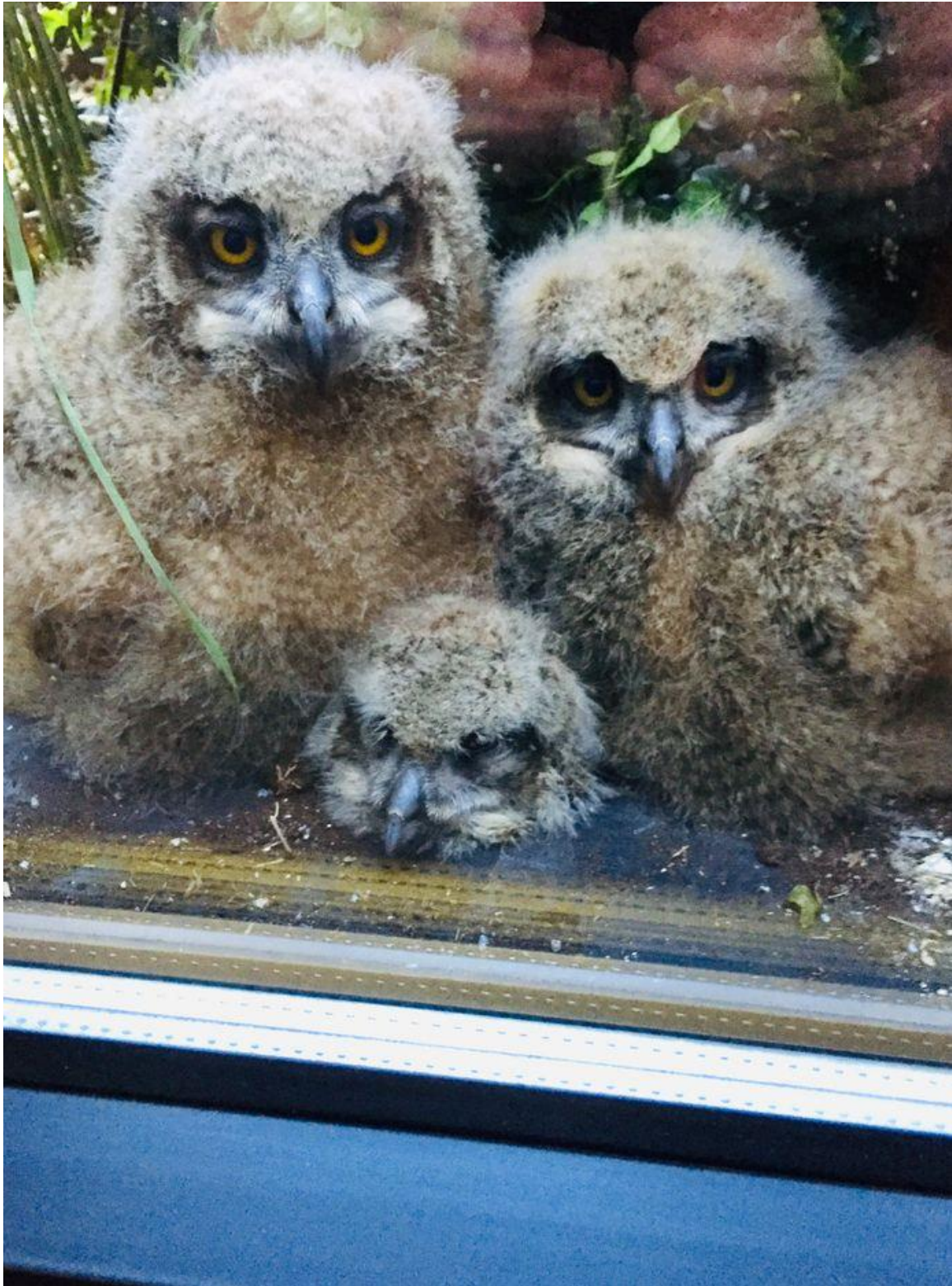
Dit zijn de 3 kleintjes op de vensterbank.

Het is bijzonder dat de oehoe op iemands vensterbank zit want de oehoe zit normaal in het bos.